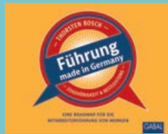
Führung made in Germany