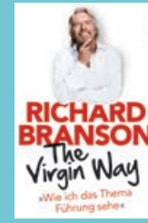
The Virgin Way